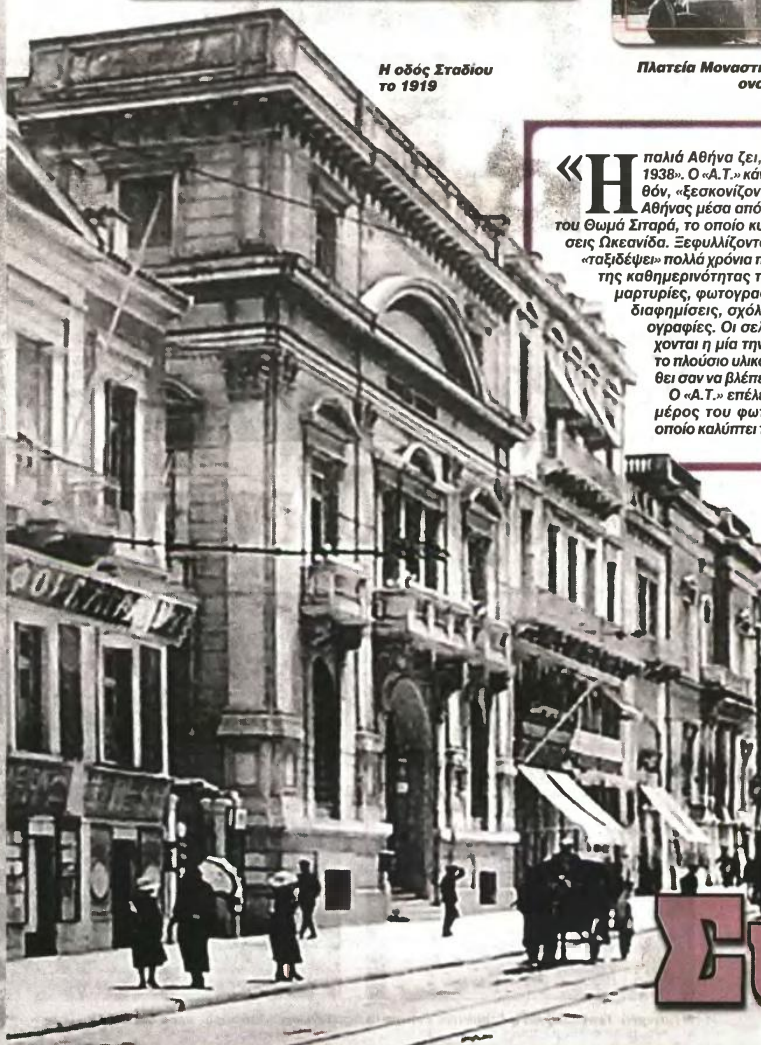
Η οδός Σταδίου το 1919

«Η παλιά Αθήνα ζει, κεντά, γεύεται. 1834-1938». Ο «Α.Τ.» κάνει αναδρομή στο παρελθόν, «ξεσκονίζοντας» μνήμες μιας άλλης Αθήνας μέσα από τις σελίδες του βιβλίου, του Θωμά Σπαρά, το οποίο κυκλοφορεί από τις εκδόσεις Ωκεανίδα. Ξεφυλλίζοντά το, ο αναγνώστης θα «ταξιδέψει» πολλά χρόνια πίσω, αντλώντας στοιχεία της καθημερινότητας των Αθηναίων μέσα από μαρτυρίες, φωτογραφίες, χρονογραφήματα, διαφημίσεις, σχόλια, ανέκδοτα και γελοιογραφήσεις. Οι σελίδες του βιβλίου διαδέχονται η μία την άλλη, αποκαλύπτοντας το πλούσιο υλικό ενός αναγνωστής νιώθει σαν να βλέπει καινούρια εποχή. Ο «Α.Τ.» επέλεξε και σας παρουσιάζει μέρος του φωτογραφικού υλικού, το οποίο καλύπτει την περίοδο από το 1910