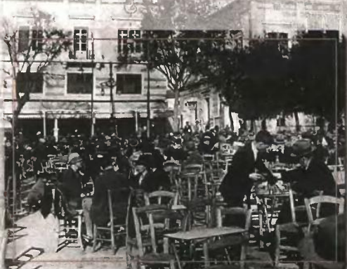
Καφενείο Ζαχαράτος στη Σταδίου. Όλοι οι άνδρες διακρίνονται να φορούν τα καπέλάκια τους

«Η παλιά Αθήνα ζει, κεντά, γεύεται. 1834-1938». Ο «Α.Τ.» κάνει αναδρομή στο παρελθόν, «ξεσκονίζοντας» μνήμες μιας άλλης Αθήνας μέσα από τις σελίδες του βιβλίου, του Θωμά Σπαρά, το οποίο κυκλοφορεί από τις εκδόσεις Ωκεανίδα. Ξεφυλλίζοντά το, ο αναγνώστης θα «ταξιδέψει» πολλά χρόνια πίσω, αντλώντας στοιχεία της καθημερινότητας των Αθηναίων μέσα από μαρτυρίες, φωτογραφίες, χρονογραφήματα, διαφημίσεις, σχόλια, ανέκδοτα και γελοιογραφήσεις. Οι σελίδες του βιβλίου διαδέχονται η μία την άλλη, αποκαλύπτοντας το πλούσιο υλικό ενός αναγνωστής νιώθει σαν να βλέπει καινούρια εποχή. Ο «Α.Τ.» επέλεξε και σας παρουσιάζει μέρος του φωτογραφικού υλικού, το οποίο καλύπτει την περίοδο από το 1910