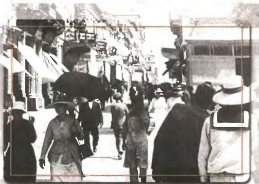
Αποψη της οδού Αιόλου το 1907

• Μνήμες μιας άλλης πόλης μέσα από τις σελίδες