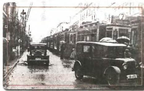
Βροχερή μέρα στην οδό Πανεπιστημίου